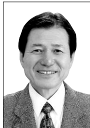
<大阪>竹谷 ☎06-6282-3929 穀物・コーヒー